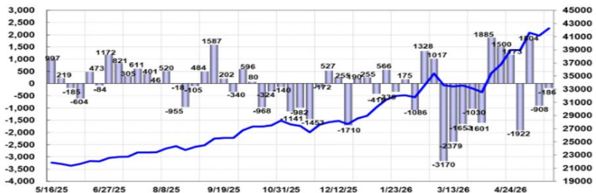
外資週買賣超及台股走勢圖 ■ 外資週買賣超-億(左軸) ▲ 加權指數週收盤價(右軸)