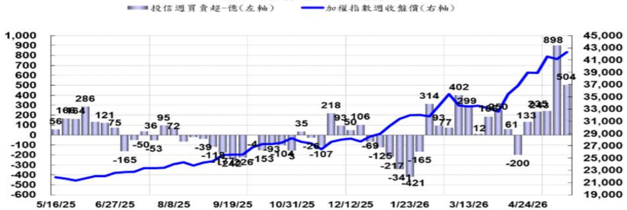
投信週買賣超及台股走勢圖