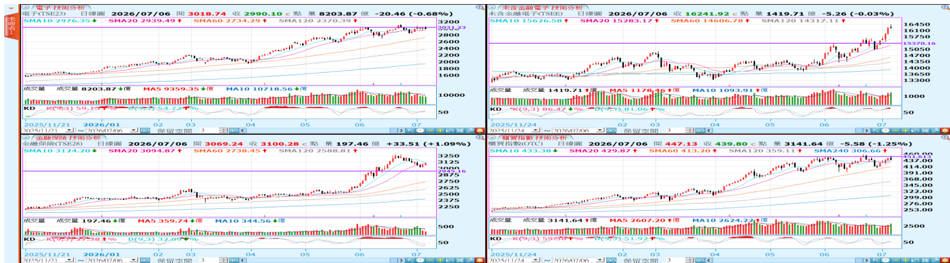
台股類股指數日線圖