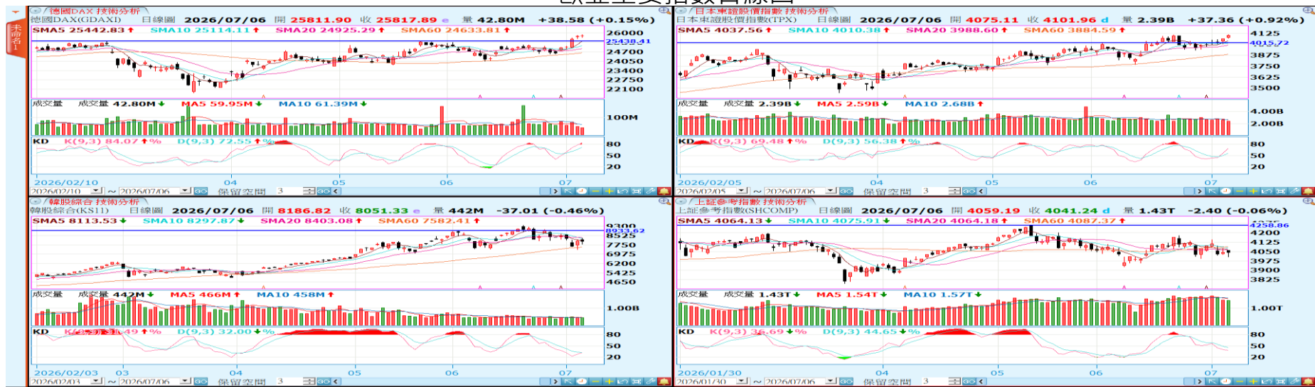
歐亞主要指數日線圖