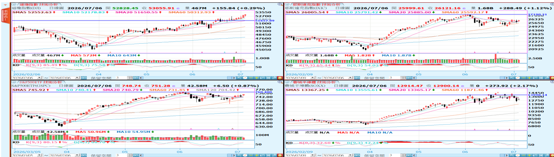
美股主要指數日線圖